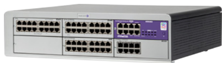
OXO Connect Medium