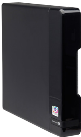
OXO Connect Compact Edition

Para competir con éxito en el mercado actual, las pequeñas y medianas empresas (PYMES) necesitan un sistema de comunicaciones altamente profesional. Gracias a su mayor simplicidad, su robustez confirmada y su conectividad, Alcatel-Lucent OpenTouch Suite para PYMES facilita el crecimiento de la PYME, todo ello por un menor coste.