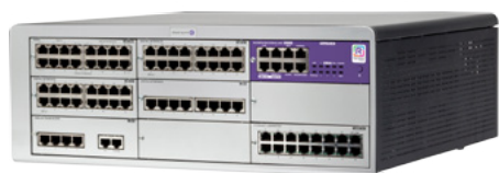
OXO Connect Large